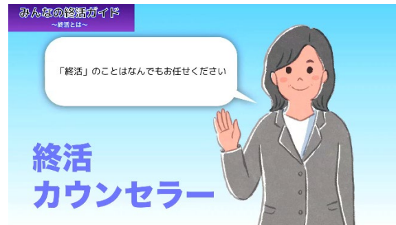
終活のプロ「終活カウンセラー」